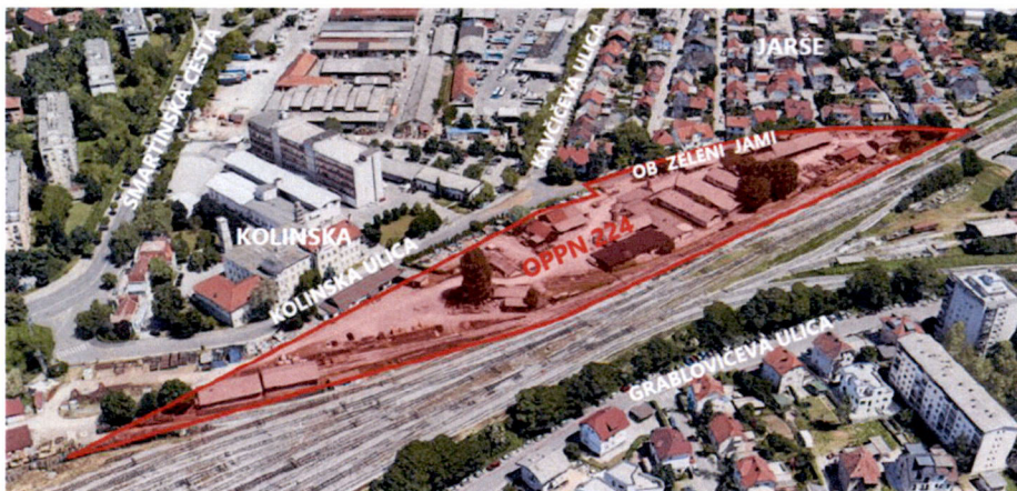
Slika 3: Pogled proti severovzhodu in na območje OPPN (rdeče), vir: google maps

Območje obdelave se nahaja v ČS Jarše, ki leži severovzhodno od mestnega središča Mestne občine Ljubljana (v nadaljevanju MOL). Leži neposredno severno od železniške povezave, ki povezuje bližnji PCL na zahodu in se nadaljuje proti vzhodu proti železniški postaji Lj-Moste in Lj-Zalog. Na severnem delu meji na Kolinsko ulico, ki se na zahodu priključi na Šmartinsko cesto, na vzhodu meji oz. delno zajema ulico Ob zeleni jami. Na samem območju OPPN 224 se nahajajo starejše industrijske stavbe, skladišča, nadstreški in objekti s poslovnim programom, ki so v večini služili oz. služijo programu in dejavnostim železnic.